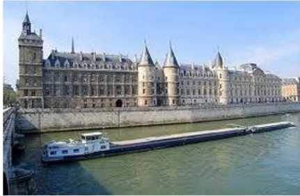
Le quai de l'horloge