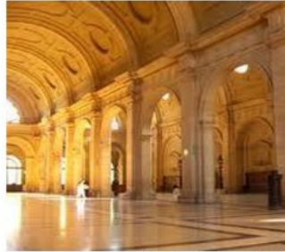
La salle des Pas Perdus