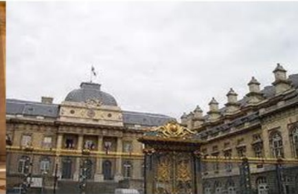
La Cour du Mai